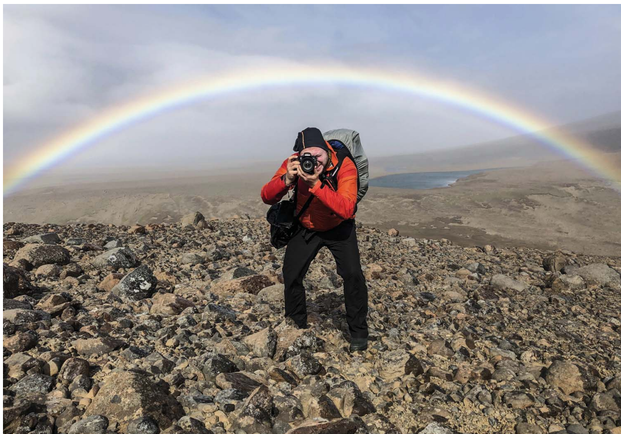
Fotograaf Christian Clauwers zag tijdens zijn expeditie onder meer stormvogels, albatrossen en zeeolifanten.